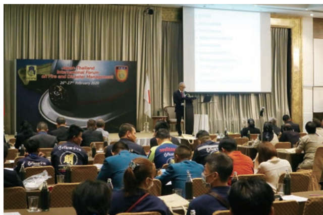
国際消防防災フォーラム (令和元年度タイ)

令和元年度はタイにおいて、同国の内務省防災局との共催で実施され、タイ側の要望等に応じて、我が国の消防における先進的な取組、消防団制度、火災予防制度、消防設備等の規格・認証制度等が紹介された。