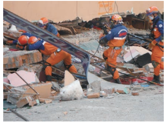
ゴンガブ地区での1階、2階が座屈したホテルにおける高度救助資機材を使用した搜索救助活動 ネパール地震災害(平成27年4月派遣)