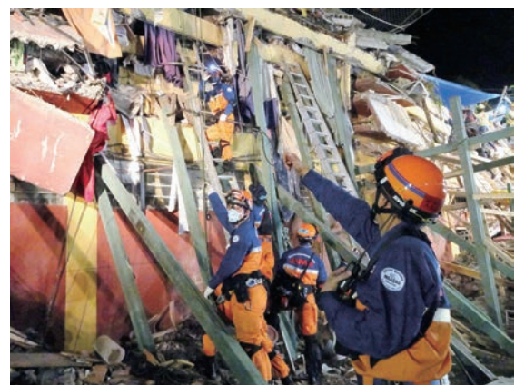
トラルパンでの搜索救助活動 メキシコ地震災害(平成29年9月派遣)

平成27年4月に発生したネパール地震災害においては、国際緊急援助隊救助チーム70人(うち国際消防救助隊員17人)が派遣された。大地震の影響により現地空港が混乱していたため、救助チームが搭乗した航空機は当初の予定どおり到着できず、予定より1日遅れでの被災地入りとなったが、現地の日本大使館及びJICA事務所を通じて、事前に情報収集を行っていたため、これまでの派遣と比較し、到着後、最も迅速に搜索救助活動を開始することができた。救助チームは、旧王宮周辺、サクー、ゴンガブ地区等で搜索救助活動を行い、派遣期間は2週間に及んだ。これは、追加派遣を行わないものとしては、過去最長の派遣期間である。