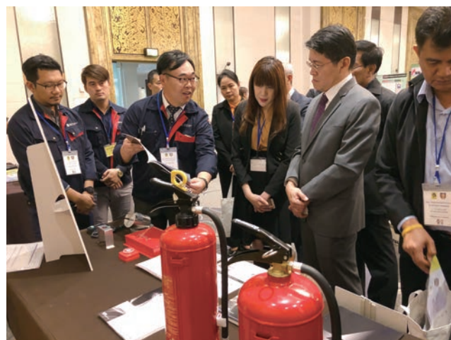
展示ブースにおける日本企業の自社製品PR

今後のフォーラムには、タイ国内から政府や地方自治体の関係者はもとより、消防防災の有識者や消防防災機器を取り扱う企業等、幅広い分野からの参加を得ることができ、官民連携して我が国の消防防災分野における知見、経験、技術等をタイの消防防災関係者に