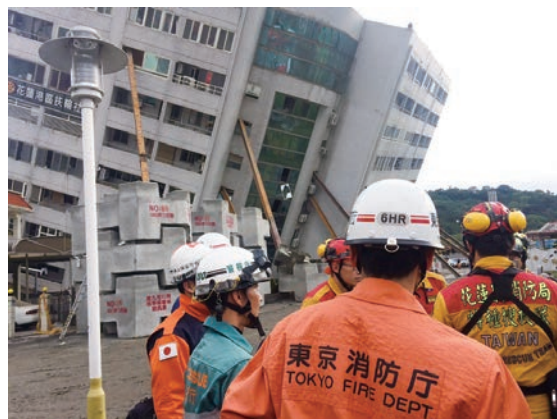
花蓮県で捜索救助活動を支援 台湾東部地震災害（平成30年2月派遣）

平成30年2月に発生した台湾東部での地震災害においては、台湾当局による捜索・救助活動を支援するため、国際緊急援助隊専門家チーム8人（うち国際消防救助隊員2人）が派遣された。余震が続く中、専門家チームは到着直後から現地救助隊に対して捜索用資機材の取扱指導や捜索活動の助言を実施した。今回の専門家チーム派遣は、東日本大震災の際に台湾が行った支援に対する日本側の恩返しと受け止められ、現地で高く評価された。